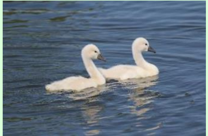
KNOBBELZWAAN (+/- 2 MAANDEN OUD)