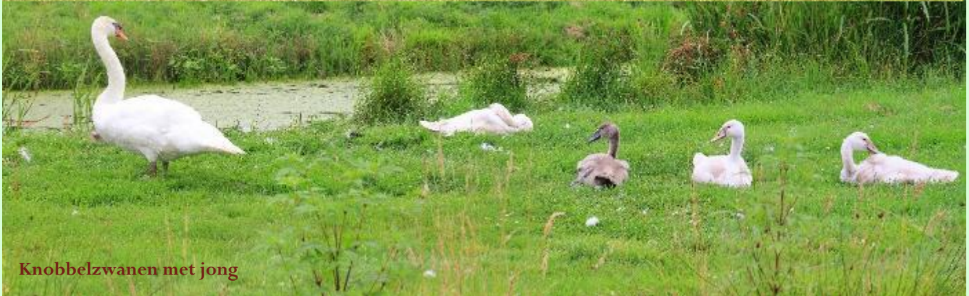
Knobbelzwanen met jong