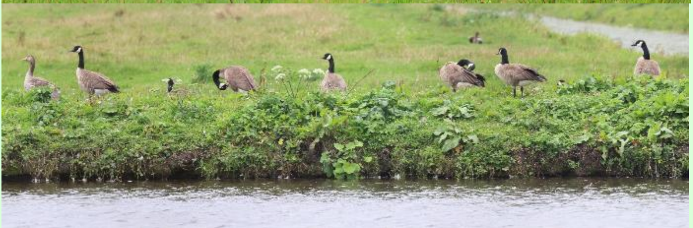
Grote Canadese gans met jong