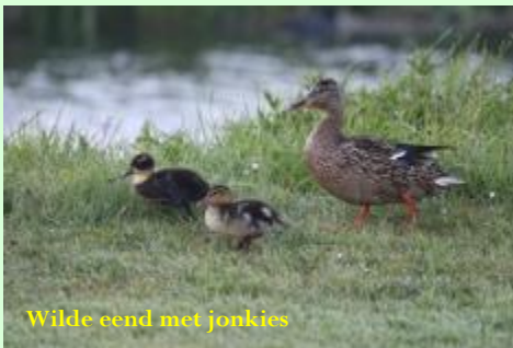
Wilde eend met jonkies

We merken dat er meer golfers de golfbaan op komen en gaan daarom onze waarnemingen verplaatsen. Het binnenste gedeelte hebben we inmiddels afgelopen en gaan verder speuren aan de buitenkant van de golfbanen. We verwachten dat de vogels daar ook naar toe zullen gaan, weg van die drukte! Via hole 1 van de torenbaan gaan we (met de cijfers van de klok mee) naar hole 18. Net zoals op de bovenlanden vinden we in de rietkragen redelijk veel kleine karekiet en af en toe koppeltjes rietgorzen. Ook hier laat de kleine karekiet zich verleiden door het geluid uit de vogel-app en lukt het om er foto's van te maken.