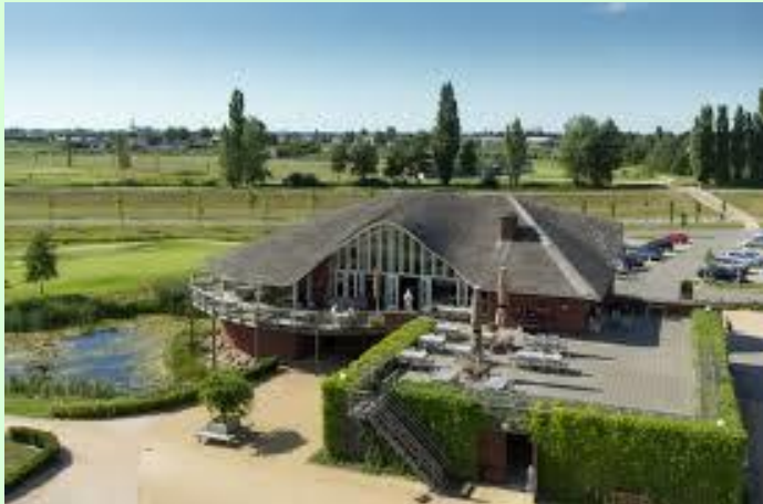
GOLF & COUNTRYCLUB LIEMEER