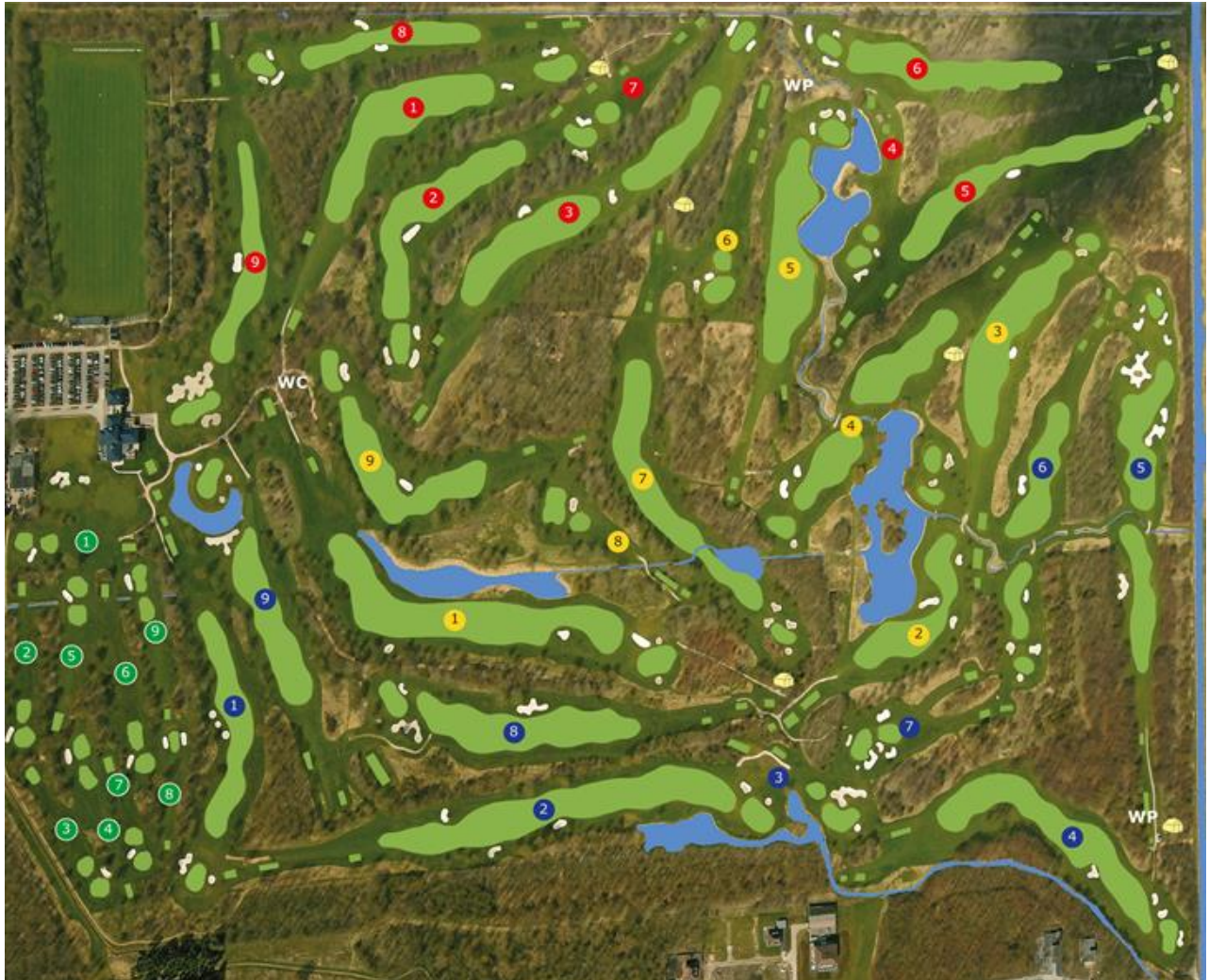
Afbeelding 3.6: Voorbeeld van een baan met een "logisch eindpunt".

Noot: Een club kan het spelen van rondes over 10 tot en met 17 holes niet verbieden.